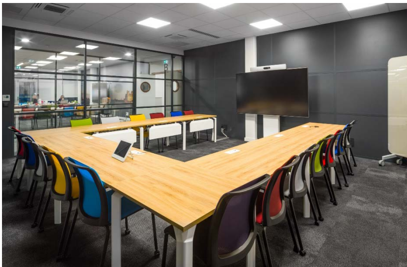
上图, 培训室采用Epure会议桌

Joncquel继续说道：“了解可预订空间的占用率是开发和改善我们设施布局的下一个挑战。”